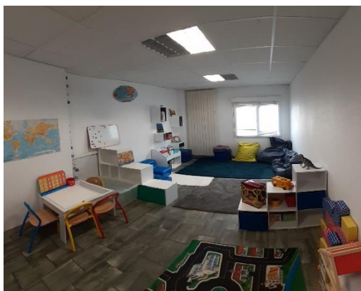
Salle aménagée spécifiquement pour Histoire de Dire

La crise sanitaire explique la baisse importante du nombre d'ateliers en 2020. L'action « Histoire de Dire » s'est en effet arrêtée au premier confinement (mi-mars jusqu'à l'été), a repris à l'automne puis a dû à nouveau s'interrompre au second confinement, après les vacances de la Toussaint.